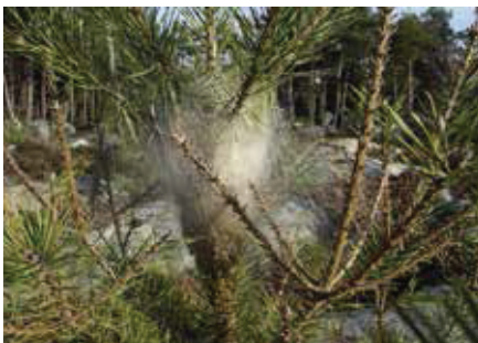
Nid d'hivernation sur jeune pin.

La processionnaire du pin est la larve d'un papillon de nuit. Ces chenilles s'attaquent aux pins et aux cèdres en consommant leurs aiguilles. Bien que localement impressionnante, la consommation des aiguilles n'entraîne généralement pas la mortalité des arbres atteints. L'inconvénient majeur de cet insecte réside surtout sur les urtications qu'il provoque chez l'homme, ainsi que chez les animaux domestiques et sauvages.