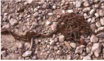
Chenilles en procession sur le sol.